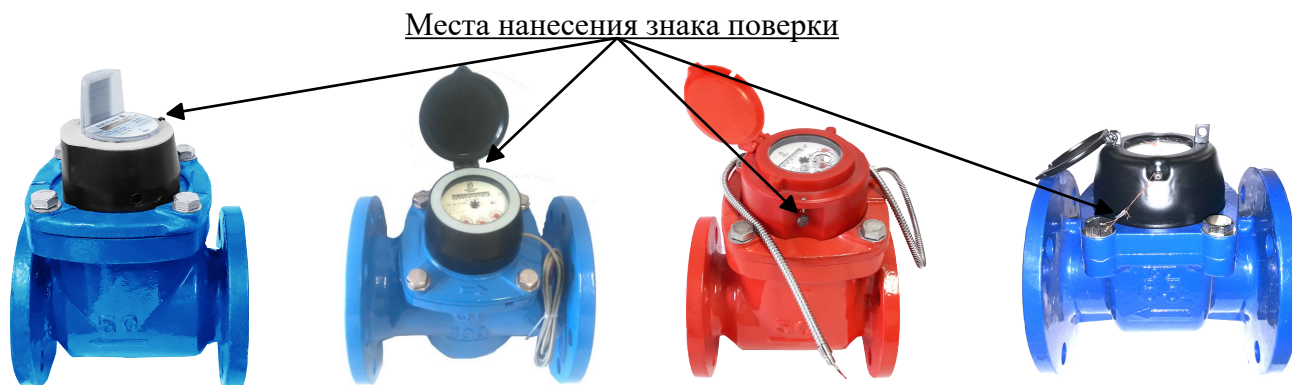
Рисунок 1 - Общий вид счетчиков холодной и горячей воды турбинных Декаст

Общий вид счетчиков и схема пломбировки приведены на рисунках 1, 2.